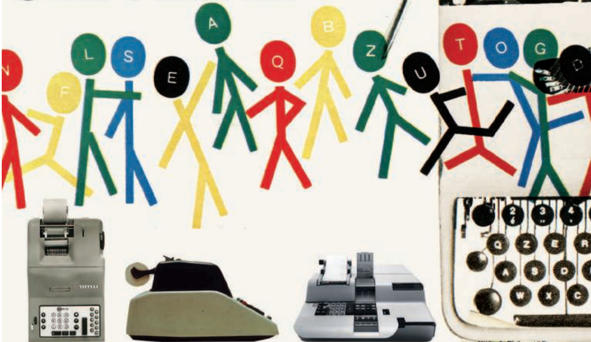
DIVISUMMA 14 Disegnata da Marcello Nizzoli nel 1948, è la prima macchina calcolatrice meccanica capace di eseguire quattro operazioni